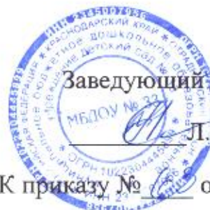
График аттестации педагогических работников на соответствие занимаемой должности в МБДОУ № 33